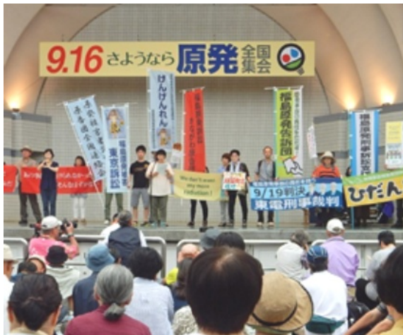
集会では、住宅補助打ち切りや裁判報告など様々な分野から報告された。

15時15分から2コースに分かれてデモ。外苑前までのコースをアツピールしながら歩いた。(Y)