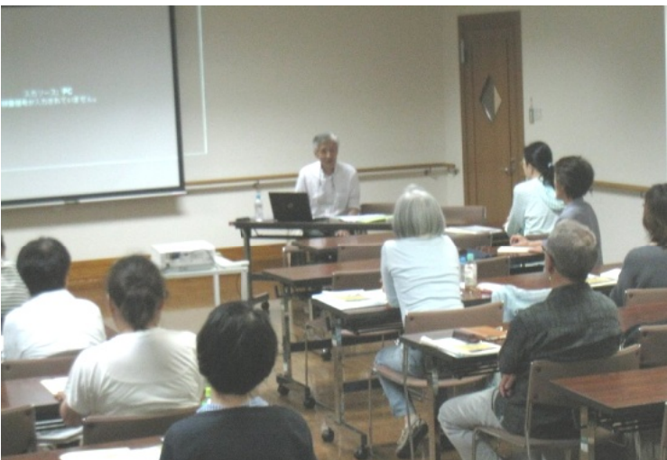
スライドを活動し「ふくしま」「現実」を報告

「原発さえなければ」こんなにもたくさん子どもたちがガンにはならず、にすんでいた筈、復興が進んでいた筈、これほどの帰宅困難者やうつ病・自殺者はいなかった筈です。腐食がすすむ原発施設も、草ボーボーで放置されて