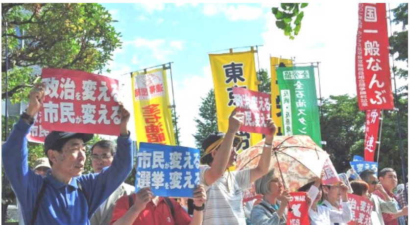
6・5総がかり行動 4万人が「明日を決めるのは私たち。戦争法廃止！参議院選挙勝利！安倍政権退陣！」と声をあげた

5月17日労基署へ告訴（刑事告訴）した。まさにマタニティハラメントであり、外国人労働者への差別でもある。みんなで応援しよう。 なお、第1回弁論は6月20日に行われたが、会社代理人受任が6月17日と、手続きが期日に間に合わず擬制陳述となった。 次期期日は7月22日の予定。静岡地裁、浜松支部