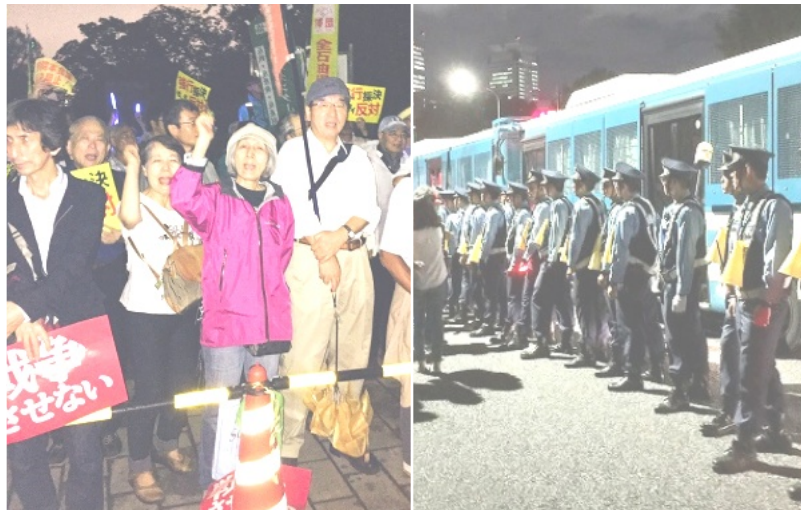
9月18日国会前の女性委員会組合同員・14日国会正門で威圧する警察