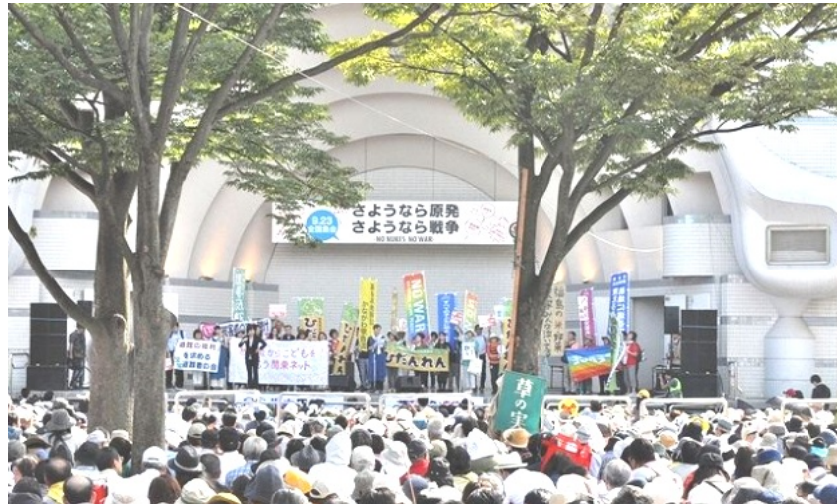
9.23さようなら原発 さようなら戦争大集会にて・福島からの訴え

派遣で働く女性は多い。派遣法の改悪（というより、派遣を全面合法化する別物と言える）で女性の派遣化は一層進むだろう。8月末には女性の活躍推進法が成立し、来年4月1日施行となるが、派遣や有期契約で働く女性たちが増えて、どうやって2020年に30%の女性が意思決定の場に行か