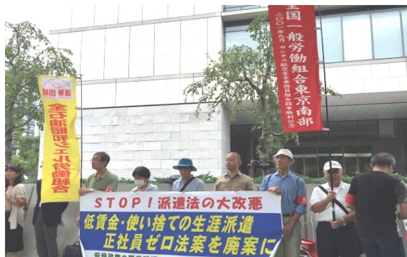
参議院議員会館前での行動でアピール（8月27日）

審議が再開されたのは3時半過ぎだった。すぐに自民党の委員が施行日延期（9月30日に）他修正案の要旨を提案、委員長は質疑がありませんねと採決にむけ意見を求めた。私は時間の都合で途中退席したが、結局採決となり委員会を通過、39項目の付帯決議がついた。9日には参議院本会議、11日衆議院本会議で再可決、成立してしまった。