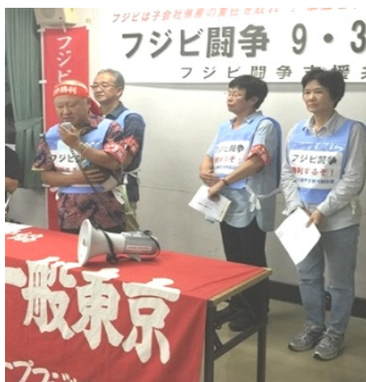
9・3決起集会で決意表明する争議団

会場変更にもかかわらず百名を超える支援の仲間たちが駆けつけ、熱気あふれる集会となった。決起集会では、大衆闘争の力で勝利を目指し奮闘することが確認された。引き続きのご支援を訴えます。