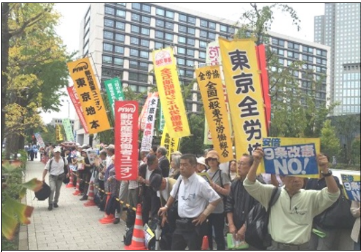
9.28国会開会・冒頭解散に2500名が抗議!

ところが、急な衆議院解散の動きで、自民党は法案の了解を先送りし、2年間継続審議となっていた高度プロ法導入や裁量労働の拡大等の労基法改悪案